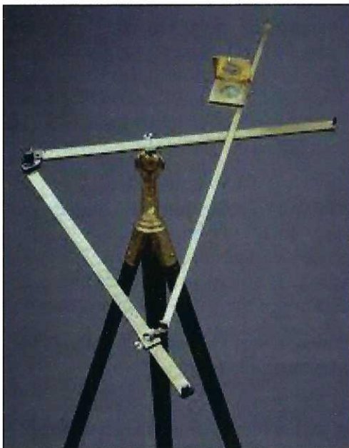
Abb. 5: Triangular-Instrument, 1613