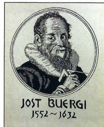
Abb. 1: Jost Bürgi, in einer Darstellung von Ägidius Sadeler (1619)

Jost Bürgi (1552 -1632) wird in Lichtensteig (Toggenburg, SG) geboren. Schriftliche Zeugnisse von Bürgi tauchen erst wieder auf, als er im Alter von 27 Jahren Hofuhrmacher am Fürstenhof Wilhelms IV. in Kassel wird. Im Jahre 1604 ernennt ihn Kaiser Rudolf II. zum Kaiserlichen Hofuhrmacher in Prag. Dort arbeitete Bürgi mit dem grossen Astronomen Johannes Kepler zusammen. Es sollte sich alsbald der vielleicht dramatischste Weltbild-Umbruch in der europäischen Kulturgeschichte anbahnen.