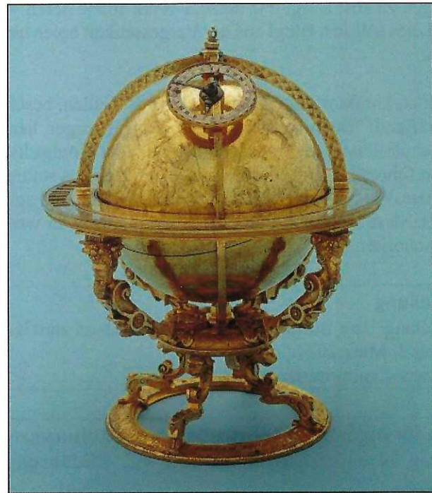
Abb. 4: Bürgi Globus, 1594