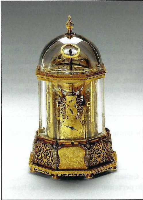
Abb. 3: Wiener Kristalluhr, 1622/1627

In dieser Tätigkeit brachte Jost Bürgi auf verschiedenen Gebieten herausragende Leistungen hervor: Als Uhrmacher baute er präzise, aber auch ästhetische Uhren (u.a. Wiener Kristalluhr, Abb. 3) und Himmelsgloben (Abb. 4) mit neuen technischen Lösungen. Als Instrumentenbauer konstruierte er genauere und einfacher zu handhabende Instrumente zur Vermessung und Sternbeobachtung (u.a. Sextant und Triangular-Instrument, Abb. 5). In der Mathematik schliesslich entwickelte er neue Rechenverfahren (u.a. die Prosthäresis und seine berühmten Progress-Tabulen (Abb. 6), ein Vorläufer der Logarithmentabellen), um die grosse Menge an Berechnungen in der Astronomie schnell und elegant auszuführen.