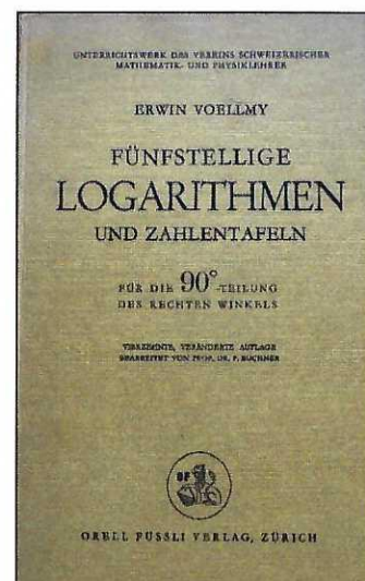
Abb. 2: "LOGARITHMEN" von Ernst Voellmy (1962) (Quelle: VSMP, Orell Füssli Verlag)